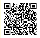
九産大図書館 ギャラリーページ

正月引札以外にも、薬関係の引札も所蔵しています。こちらの引札は、江戸時代に須恵で盛んになった「正明膏（しょうめいこう）」という目薬を引き継いだ眼科田原家のものです。