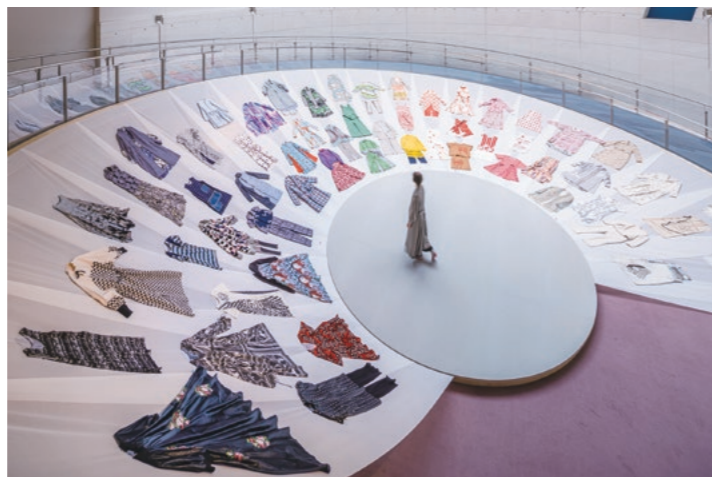
「スパイラルガーデン(東京)での展示風景」

2022年で20周年を迎えたファッションブランド「ミントデザインズ」のこれまでの足跡を辿る展覧会です。これまで手がけた40シーズンのコレクションを年代、テーマ別に分けた映像コンテンツをはじめ、コレクションルックや、グラフィックテキスタイルを展示するほか、ミントデザインズを形作る数々の要素を抽出します。ミントデザインズの世界観、思考を様々な角度からご紹介します。